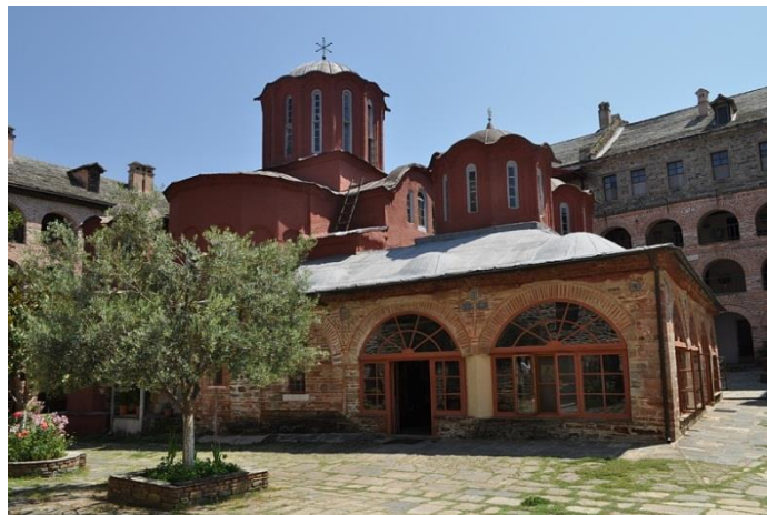
Монастырь Кутлумуш (Святая Гора Афон)

В обращении афонских монахов отмечается что, «сегодня особенно поверхностным и легкомысленным является использование преподобного Паисия Святогорца для того, чтобы якобы распространить православную истину (яркий пример – размещение аудио файлов якобы с голосом старца, в которых слышен голос совсем другого человека!). Мы опасаемся, что это призвано удовлетворить сегодняшнюю одержимость пророчествами, одержимость, возросшую на дефиците веры, и восстанавливает "дух рабства, чтобы опять жить в страхе"». По словам святогорцев, «пророчество дается для покаяния, нашего возвращения к Богу, а не организации нашей личной жизни или самоуспокоенности».